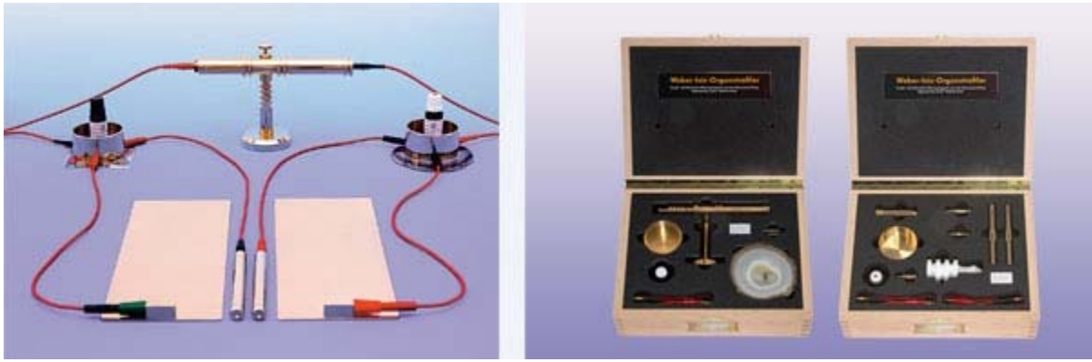
Abb. 5: Aufbau für das Bioresonanz-Prinzip Abb. 6: Der Isis-Organstrahler und das Isis-Ergänzungs-Set ergeben zusammen das Isis-Komplett-Set.