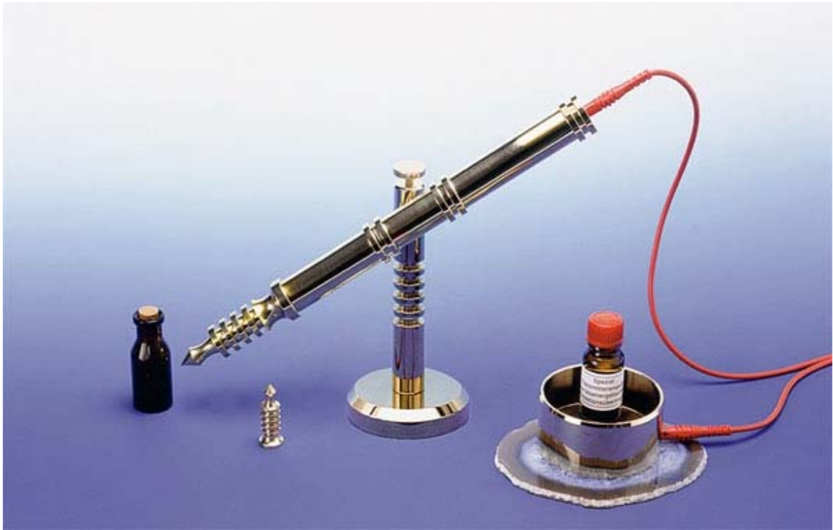
Abb. 7: Isis-Organstrahler (Messing vergoldet) mit Reduzierstück und Turbolader zur 1:1 Übertragung.